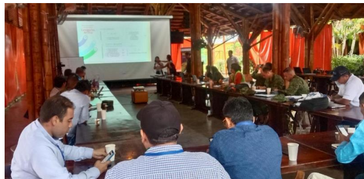
Fotos Taller de Socialización propuesta PRE departamento de Vichada